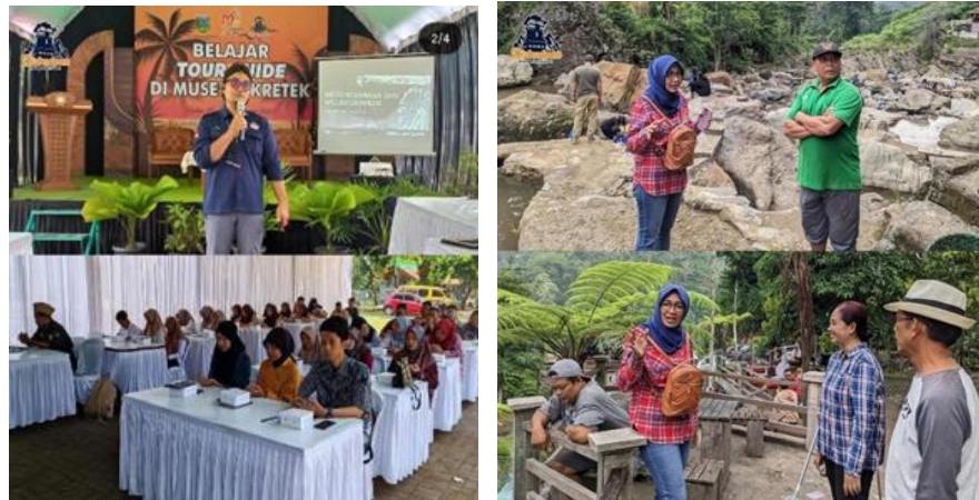
Gambar 2. Pelatihan Tour Guide Desa Wisata

Gambar 2 menunjukkan aktivitas simulasi pemandu wisata yang dilakukan oleh peserta dalam suasana pelatihan yang interaktif. Peserta secara bergantian mempraktikkan peran sebagai pemandu wisata di hadapan peserta lainnya, sehingga tercipta suasana pembelajaran yang dinamis. Kegiatan ini memberikan pengalaman langsung dalam menyampaikan informasi wisata secara komunikatif dan sistematis, sekaligus melatih kepercayaan diri peserta dalam berbicara di depan umum.