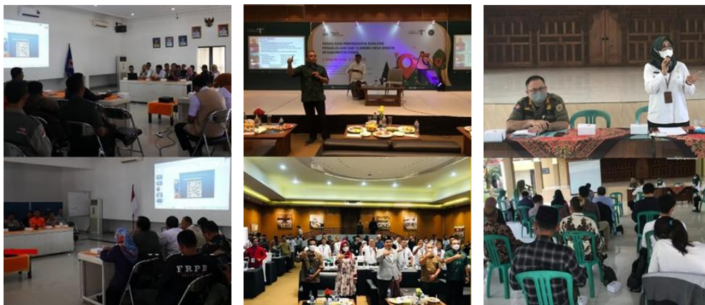
Gambar 1. Sosialisasi Peningkatan Kualitas Melalui Sinergi Antar Pihak

Proses sosialisasi tidak hanya berlangsung secara satu arah, tetapi juga dikemas dalam bentuk diskusi interaktif yang melibatkan seluruh peserta. Forum ini menjadi ruang dialog antara masyarakat, pemerintah, dan akademisi dalam mengidentifikasi potensi serta permasalahan yang dihadapi dalam pengelolaan desa wisata. Berbagai isu yang mengemuka dalam diskusi antara lain terkait keterbatasan kapasitas sumber daya manusia, belum optimalnya koordinasi antar kelembagaan, serta perlunya strategi promosi yang lebih terarah dan berkelanjutan. Melalui proses ini, peserta didorong untuk lebih aktif dalam menyampaikan pandangan dan pengalaman yang dimiliki, sehingga tercipta proses pembelajaran yang partisipatif.