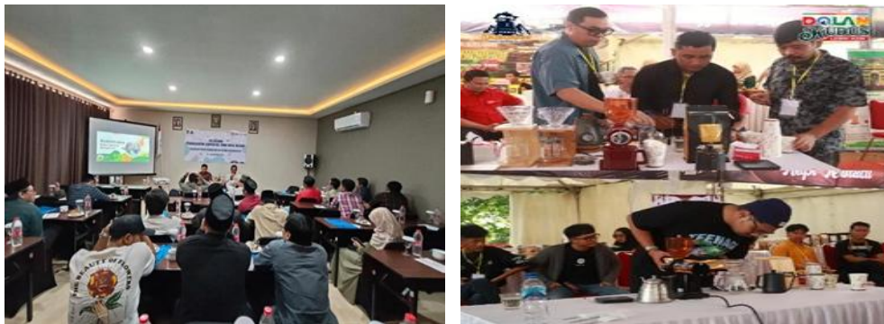
Gambar 3. Pelatihan Peningkatan Kapasitas SDM Desa Wisata

Pendekatan pelatihan tidak hanya bersifat teoritis, tetapi juga mengedepankan diskusi partisipatif dan pemecahan masalah. Peserta didorong untuk mengidentifikasi berbagai kendala yang dihadapi dalam pengelolaan desa wisata, seperti koordinasi antar kelembagaan, pengelolaan potensi wisata yang belum optimal, serta keterbatasan dalam perencanaan program wisata. Melalui proses ini, peserta tidak hanya memperoleh pengetahuan baru, tetapi juga mampu merumuskan solusi yang dapat diterapkan secara langsung di lingkungan mereka. Pendekatan ini bertujuan untuk membangun kemandirian masyarakat dalam mengelola dan mengembangkan desa wisata secara berkelanjutan (Darmi & Harini, 2024).