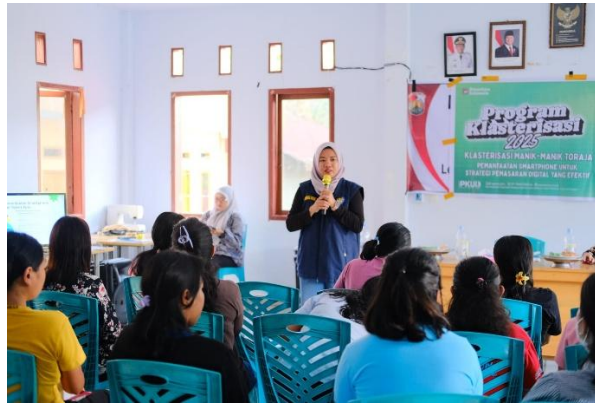
Gambar 1. Partisipasi aktif ibu – ibu UMKM Lembang Angin-Angin

hasil observasi dan kegiatan pendampingan pelatihan terhadap pelaku UMKM di Lembang Angin-Angin di Toraja Utara: