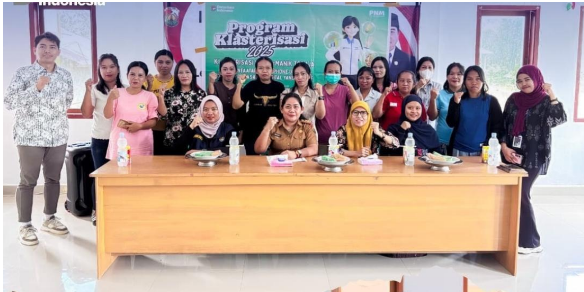
Gambar 3. Suasana semangat kolaboratif kegiatan penguatan kapasitas di Kantor Lembang Angin-Angin

Implikasi dari kegiatan ini adalah peningkatan kapasitas digital UMKM di Lembang Angin-Angin, Toraja Utara efektif bila diarahkan pada: (1) standardisasi saluran utama WA Business; (2) penguatan identitas dan katalog; (3) produksi konten sederhana namun konsisten; (4) tata kelola respons pelanggan; dan (5) monitoring ringan berbasis indikator yang mudah di catat. Dengan pendekatan tersebut smartphone tidak hanya menjadi alat komunikasi, namun juga menjadi perangkat strategi pemasaran yang berdampak pada perluasan pasar dan peningkatan daya saing UMKM.