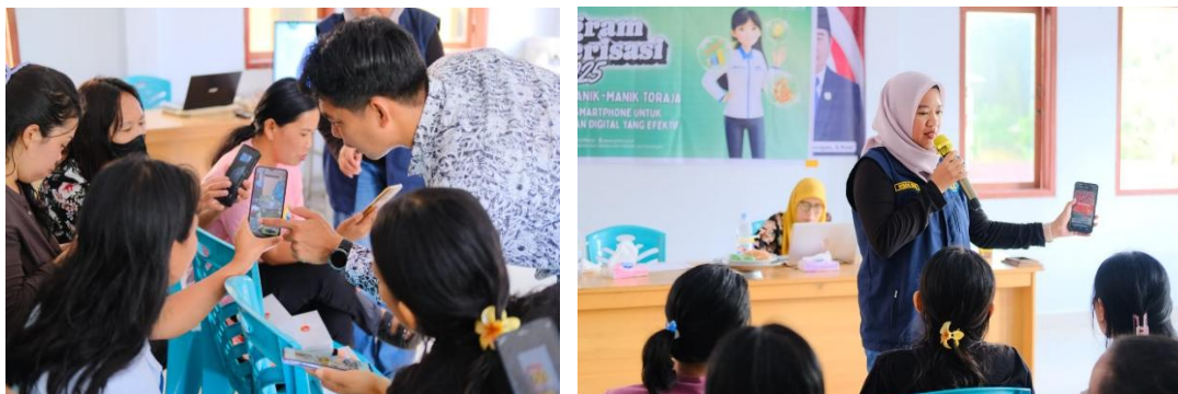
Gambar 2. Pelatihan pemanfaatan Smartphone

Hasil tersebut menunjukkan bahwa smartphone merupakan media yang sangat relevan untuk strategi pemasaran digital UMKM di Toraja Utara karena hambatan utama UMKM bukan pada ketersediaan perangkat, melainkan pada strategi dan keterampilan penggunaan fitur digital. Ketika peserta diberikan pelatihan yang langsung praktik dan disertai pendampingan, perubahan terjadi relatif cepat. Identitas usaha menjadi lebih jelas, komunikasi pelanggan lebih tertata dan konten promosi lebih menarik. Hal ini memperkuat temuan bahwa pendekatan pelatihan lebih efektif dibanding pelatihan teoritis, karena UMKM membutuhkan output langsung yang bisa dipakai pada hari yang sama.