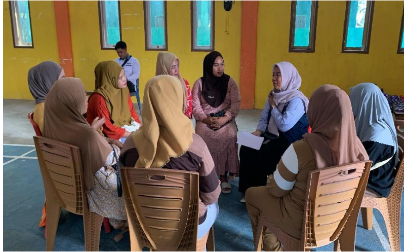
Gambar 3. Diskusi kelompok kecil bersama ibu – ibu pelaku UMKM mengenai tantangan kepemimpinan usaha