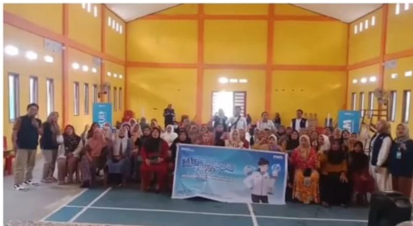
Gambar 4. Suasana semangat kolaboratif kegiatan penguatan kapasitas di aula desa Bakti.