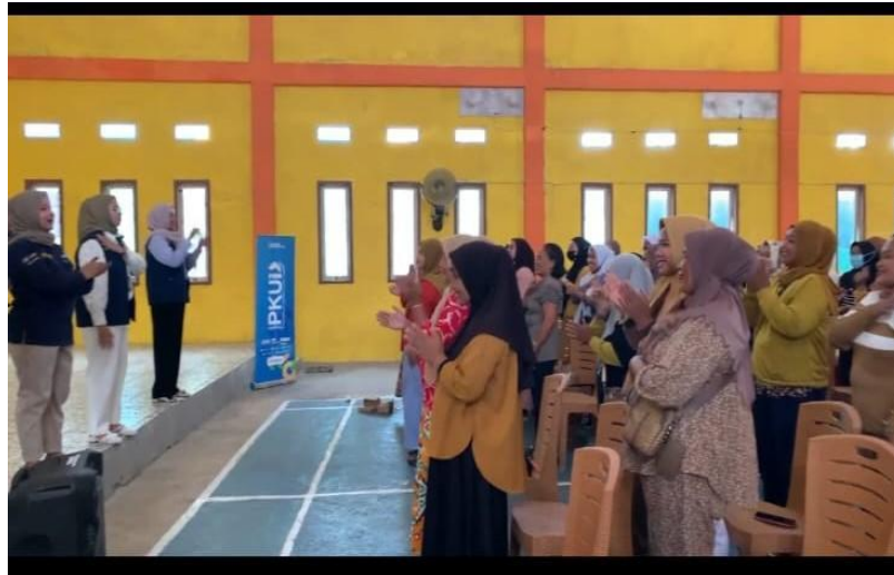
Gambar 2. Partisipasi aktif ibu – ibu penggerak UMKM dalam kegiatan

Program ini dilaksanakan selama 1 hari secara bertahap dengan tindakan partisipatif. Materi pelatihan meliputi: komunikasi interpersonal, pengambilan keputusan, kepemimpinan kolaboratif, manajemen emosi, dan kerja tim. Metode pembelajaran yang digunakan berupa ceramah interaktif, diskusi kelompok, simulasi dan studi kasus yang relevan dengan situasi nyata usaha mereka. Berikut dokumentasi hasil observasi dan interaksi awal dengan ibu-ibu pelaku UMKM di Ponrang Selatan: