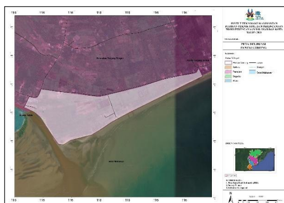
Gambar 1. Peta Deliniasi Pantai Corong

Sebelah Barat : Muara Tunan, Kecamatan Waru